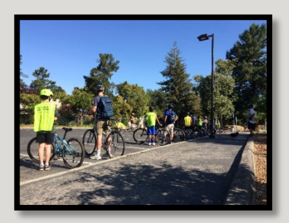
Socially Distant Middle School Bike Skills Workshop